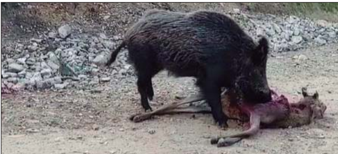
Figura 1. Jabalí consumiendo despojos de una montería. El hábito carroñero de esta especie le hace especialmente susceptible a contraer la tuberculosis animal

El Plan de Actuación sobre Tuberculosis en Especies Silvestres (PATUBES) identifica la correcta gestión de los subproductos animales no destinados al consumo humano (SANDACH) derivados de la caza como una de las principales medidas que deben ser tomadas para evitar la transmisión de enfermedades presentes en la fauna a otras especies tanto domésticas como silvestres. Resulta evidente que abandonar vísceras accesibles para jabalíes y otros carnívoros oportunistas no hará sino continuar el ciclo de enfermedades como la tuberculosis o la triquinosis.