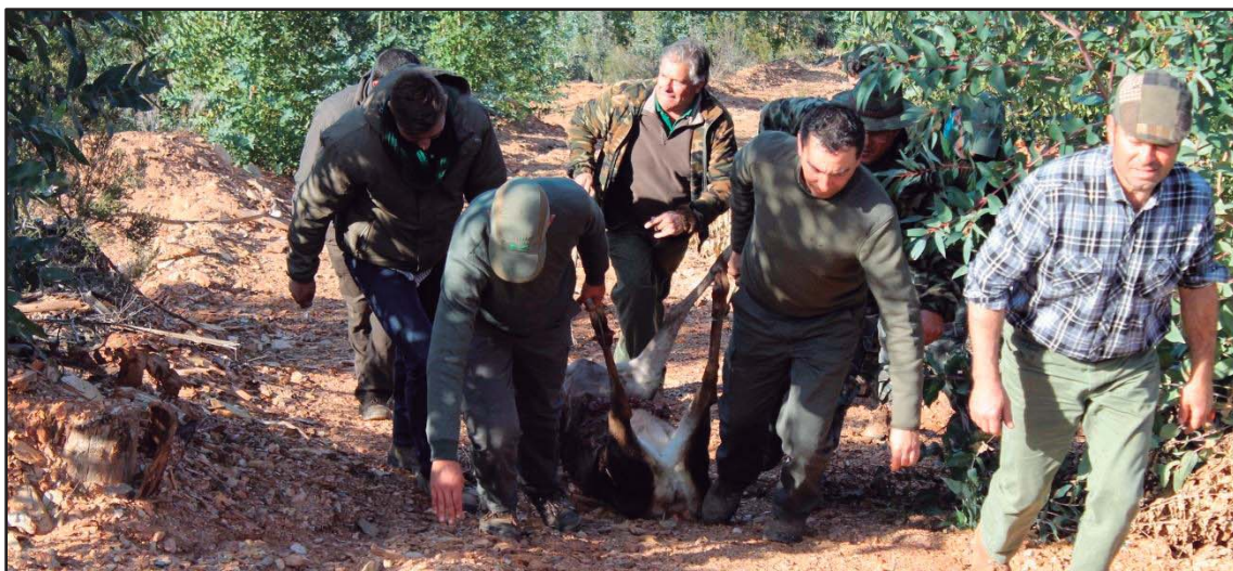
Figura 7. En zonas de difícil acceso, debido a la orografía u otras características del terreno, se deberían establecer excepciones en la normativa que promuevan la viabilidad de la eliminación de los despojos de la cacería

También se deberían establecer excepciones para piezas abatidas en zonas de difícil acceso , como la caza en alta montaña, donde la orografía hace inviable la extracción del cuerpo entero. Quizás la mejor opción para estos casos excepcionales sería dejar los despojos en zonas abiertas donde pudieran ser detectados fácilmente por las aves necrófagas.