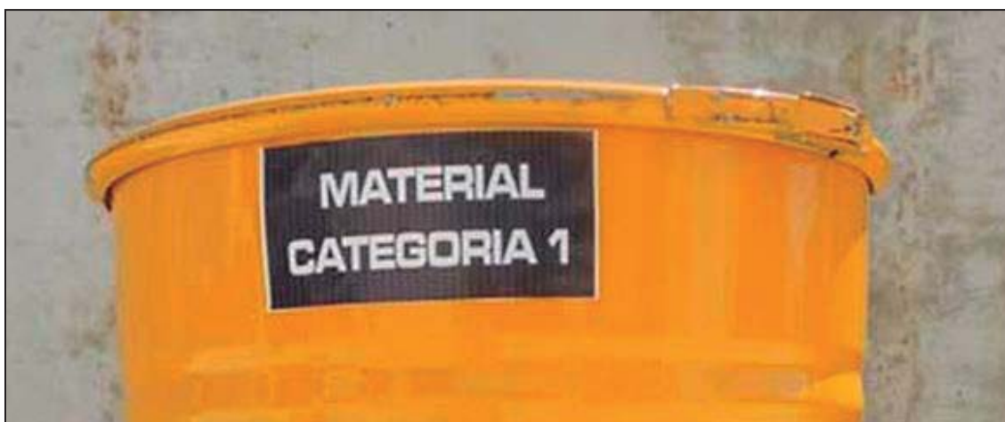
Figura 2. En el caso de actividades cinegéticas de las que se deriven SANDACH que hubiera que eliminar en establecimientos o plantas o muladares, es obligatorio disponer de contenedores con cierre hermético y estancos adecuados al volumen de SANDACH previsto eliminar, que impidan el acceso de animales terrestres y aves.

Se aplica a todas las modalidades de caza mayor, incluyendo recechos, aguardos o esperas y rondas , aunque entendiendo que estas suponen un menor riesgo en la transmisión por ser significativamente inferior el volumen de SANDACH generado. Se establecen diferentes sistemas de eliminación dependiendo de si el material es de tipo C1 (sospechoso de enfermedad) o el resto (C2 ó C3).