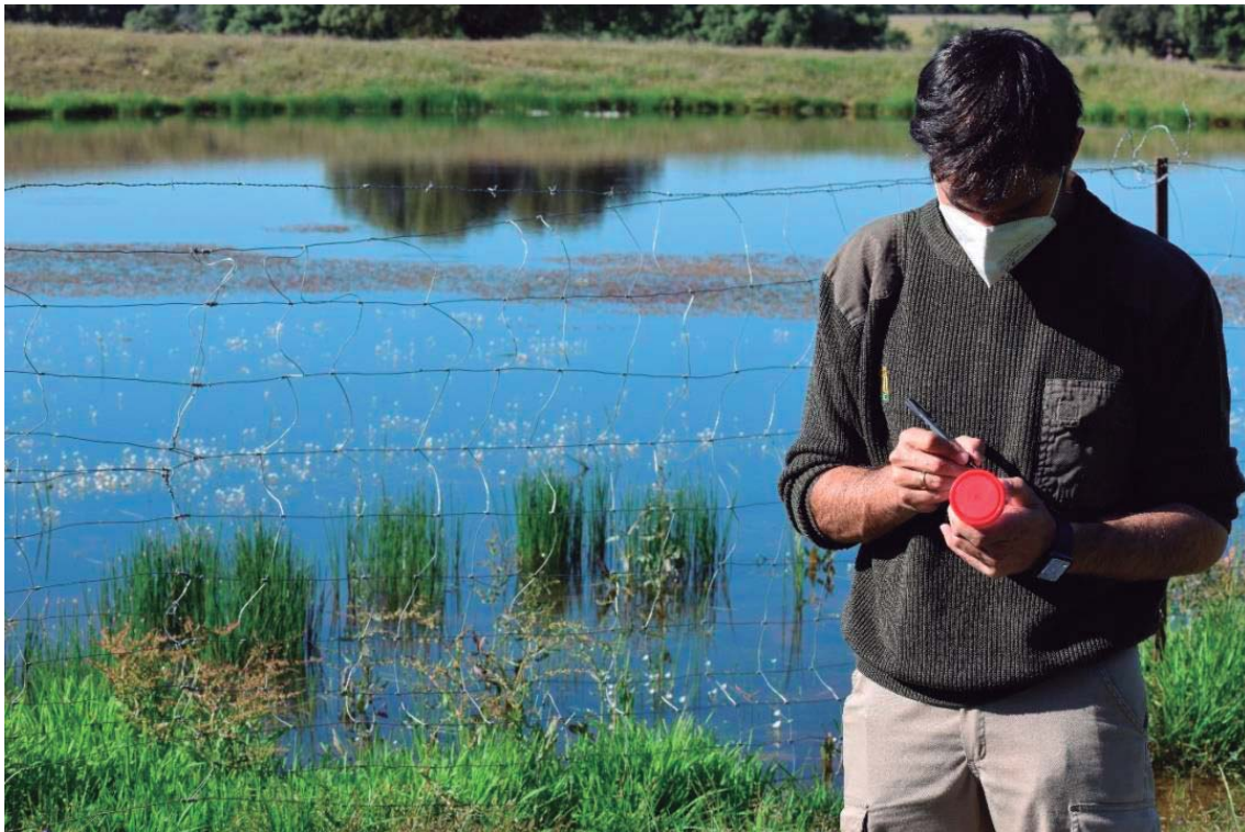
Foto 2: El riesgo de transmisión de la enfermedad se multiplica en los puntos de agua durante la estación seca