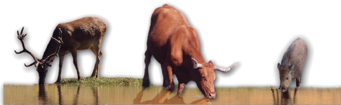
Foto 1: La TB se mantiene en la interfaz ganado doméstico-especies silvestres