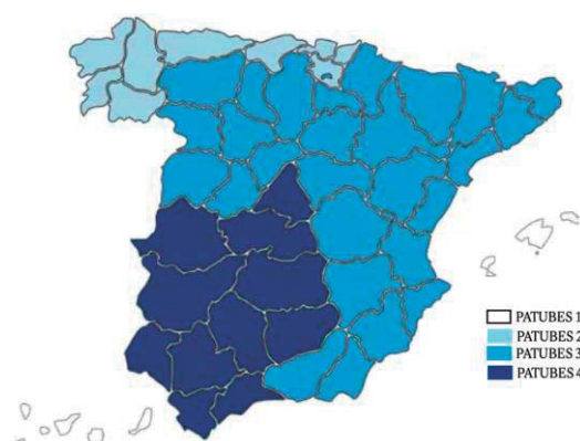
Figura 1: Mapa de las regiones PATUBES (Guía de Aplicación para el sector cinegético del Real Decreto 138/2020, por el que se establece la normativa básica en materia de actuaciones sanitarias en especies cinegéticas que actúan como reservorio de la tuberculosis, 2020. F. Artemisan 2020)