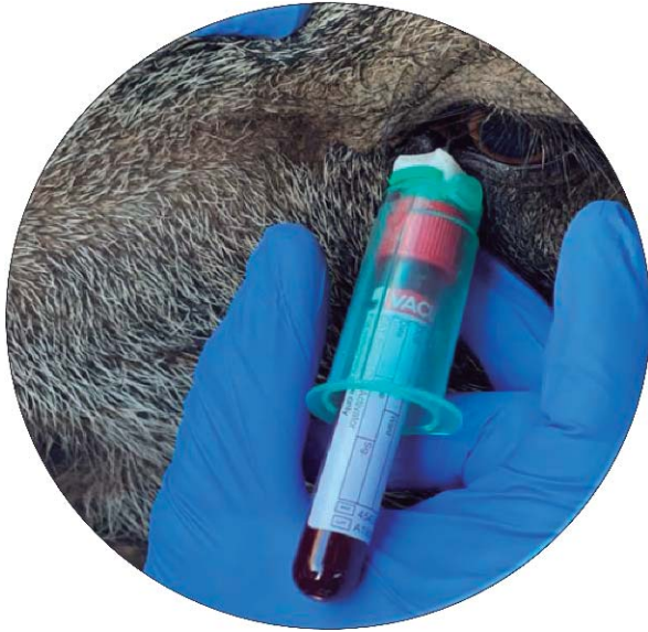
Foto 3: Punción del seno venoso oftálmico de jabalí inmovilizado mediante jaula-cepo para diagnóstico mediante ELISA para la detección de anticuerpos en suero frente al complejo Mycobacterium tuberculosis .

A partir de esta información inicial se podrá proceder a la toma de decisiones de gestión como el diseño de un plan de acción y valorar el efecto de eventuales intervenciones.